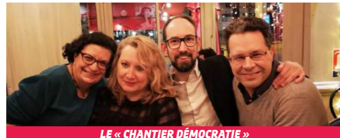
LE « CHANTIER DÉMOCRATIE »

Enfin, afin de mieux répondre aux intérêts de l'ensemble des citoyens français, une plus juste représentation de la diversité de la société française au parlement sera une clé essentielle, introduire un degré de proportionnelle en serait un moyen. La désynchronisation du cycle électoral présidentielle et législatives aiderait également à changer la nature de gouvernance actuelle où l'Élysée écrase toutes les autres institutions de notre démocratie.