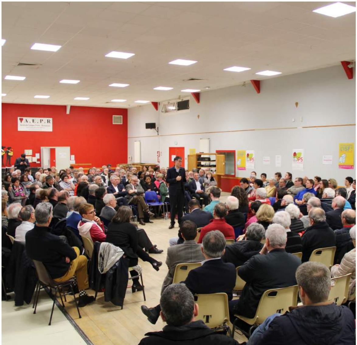
Soirée des vœux de la fédération de Loire-Atlantique du Parti socialiste, jeudi 7 février, salle de l'AEPR à Rezé