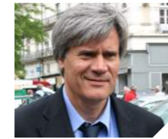
Stéphane LE FOLL