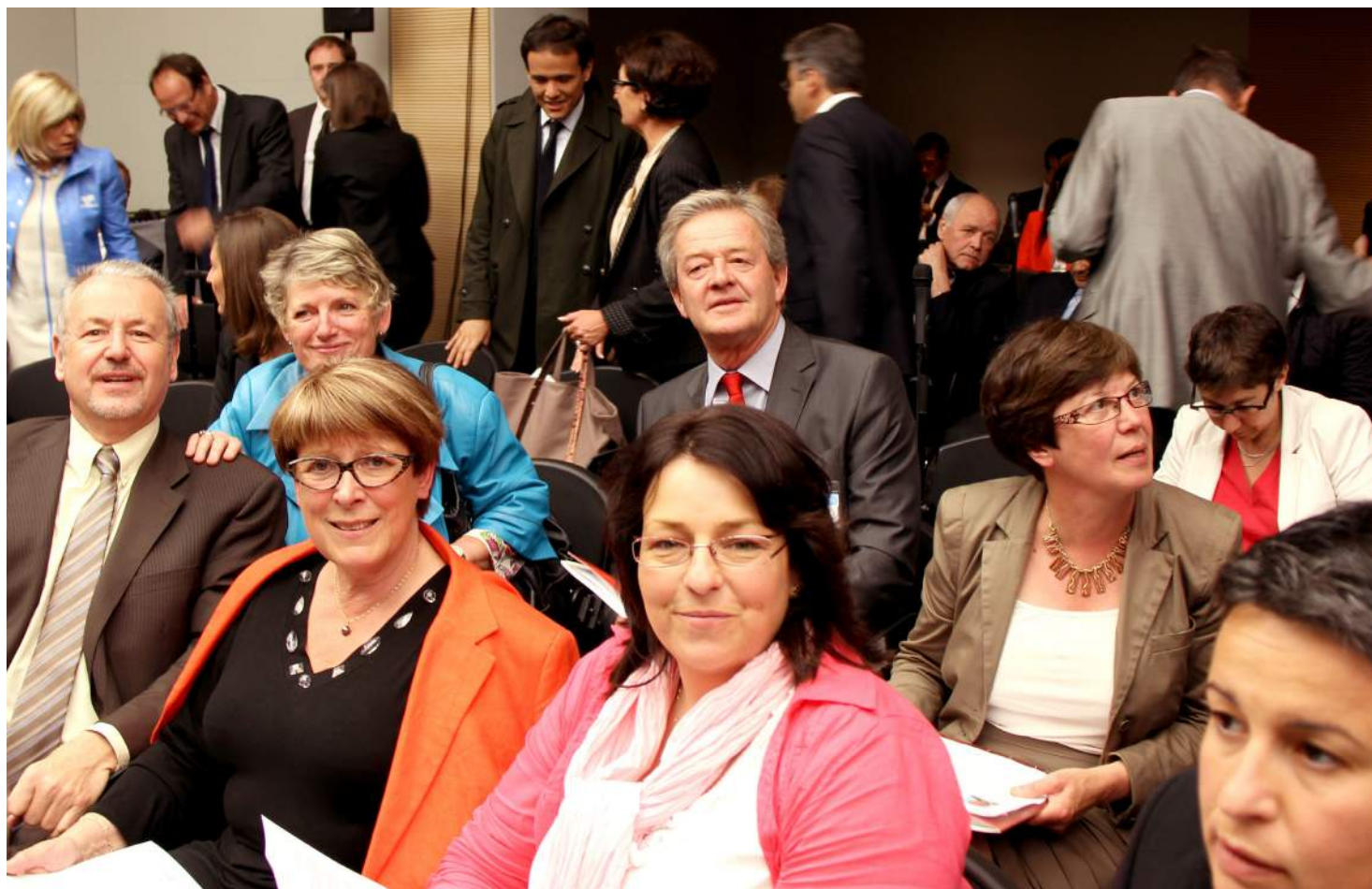
Photo prise le le 19 juin à l'Assemblée nationale, à l'occasion de la première réunion du groupe socialiste.

Le journal des socialistes de Loire-Atlantique - N°234 - Jeudi 5 juillet 2012