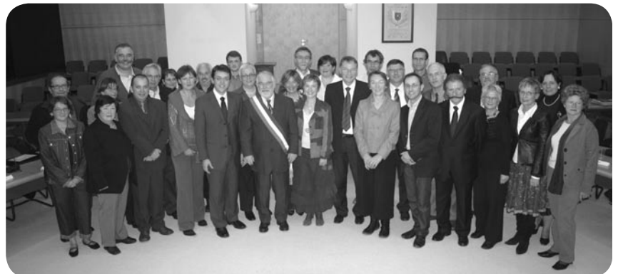
L’ensemble du nouveau Conseil municipal

Il va d’abord falloir relancer la machine municipale sur les plans administratif et financier. En effet, les crises et divisions de l’ancienne majorité ont mis en jachère nombre de dossiers depuis un an. Ensuite, nous nous attellerons à quelques chantiers comme la nouvelle salle de sport, des événements culturels et de petits équipements comme le jardin d’enfants, la piste de skateboard et le périscolaire. Aussi, j’ai demandé à mes adjoints d’être présents auprès de la population car je veux une équipe de terrain. D’ici mars, nous allons travailler avec rigueur et dans une sérénité nouvelle. Avec une méthode différente basée sur la collégialité, en lien avec les associations. En un mot, à Sainte-Luce, c’est l’alternance tranquille pour le renouveau.