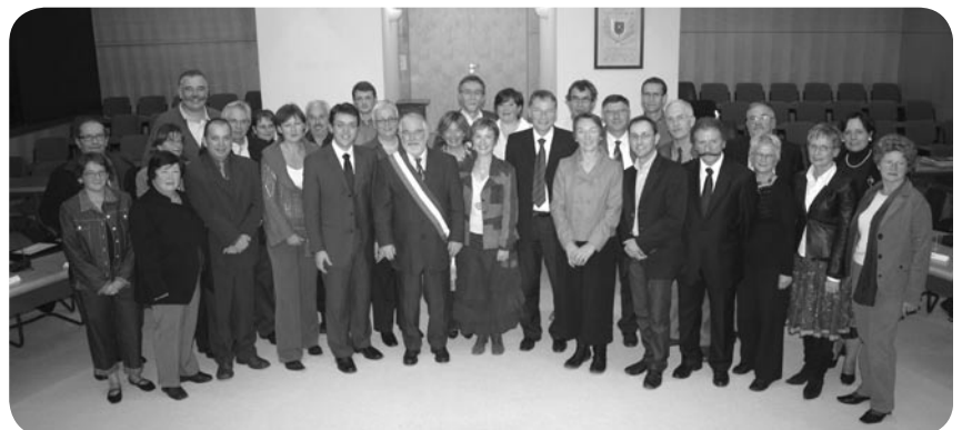
L’ensemble du nouveau Conseil municipal

Il va d’abord falloir relancer la machine municipale sur les plans administratif et financier. En effet, les crises et divisions de l’ancienne majorité ont mis en jachère nombre de dossiers depuis un an. Ensuite, nous nous attellerons à quelques chantiers comme la nouvelle salle de sport, des événements culturels et de petits équipements comme le jardin d’enfants, la piste de skateboard et le périscolaire. Aussi, j’ai demandé à mes adjoints d’être présents auprès de la population car je veux une équipe de terrain. D’ici mars, nous allons travailler avec rigueur et dans une sérénité nouvelle. Avec une méthode différente basée sur la collégialité, en lien avec les associations. En un mot, à Sainte-Luce, c’est l’alternance tranquille pour le renouveau.